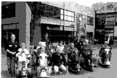
Alle deelnemers slaagden voor de Scootmobielcursus

voor de opleiding. Het bezoeken en ondersteunen van senioren die door isolement de regie over hun leven dreigen te verliezen, behoort tot de hoogste prioriteit. Met de VOA's kunnen de ouderenorganisaties een krachtige bijdrage leveren aan het succes van Knooppunt en Vitaliteitscentrum.